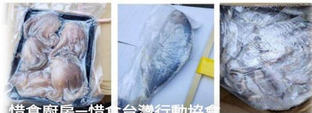
惜食廚房—惜食台灣行動協會